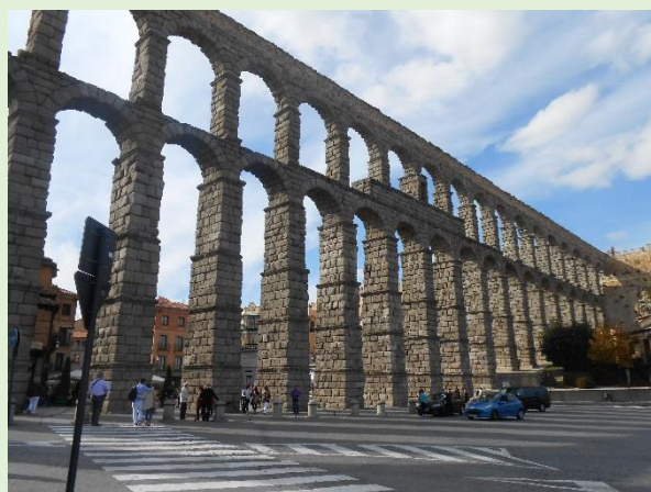
セゴビアのローマ水道橋